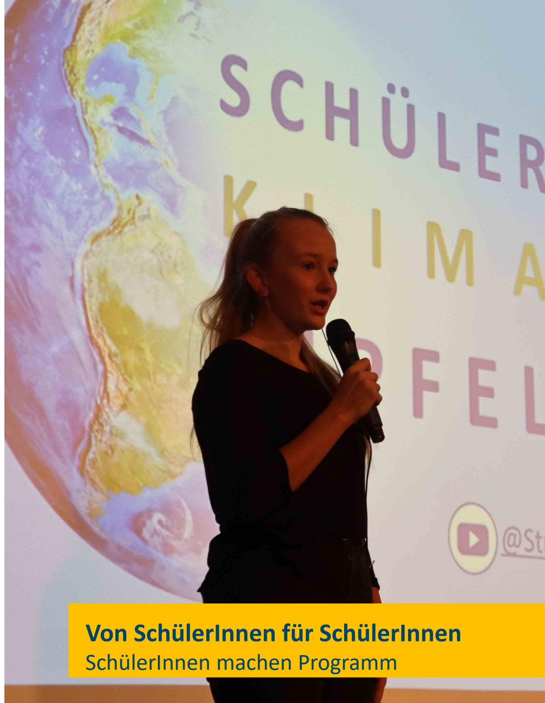
Von SchülerInnen für SchülerInnen SchülerInnen machen Programm