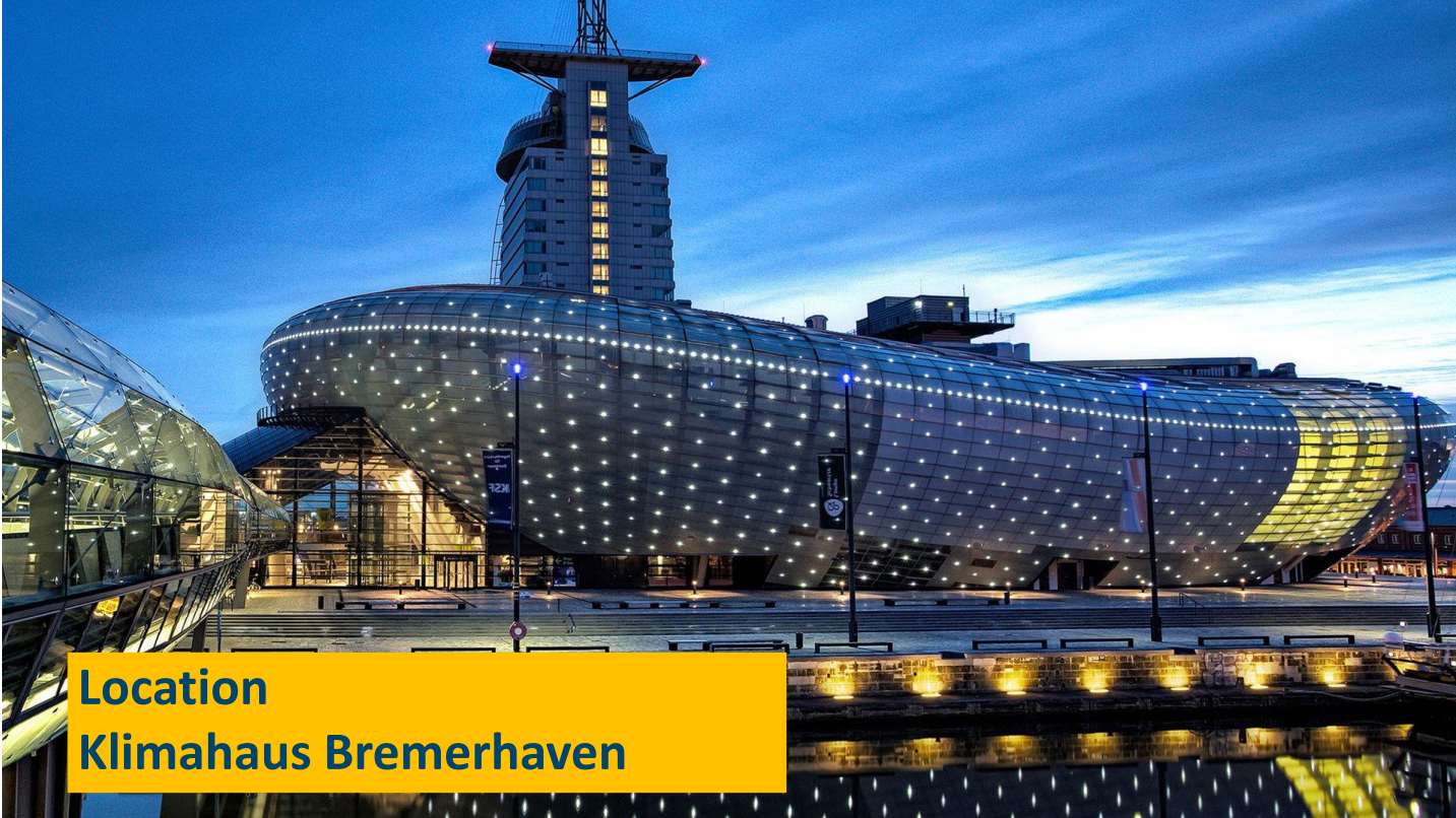
Location Klimahaus Bremerhaven