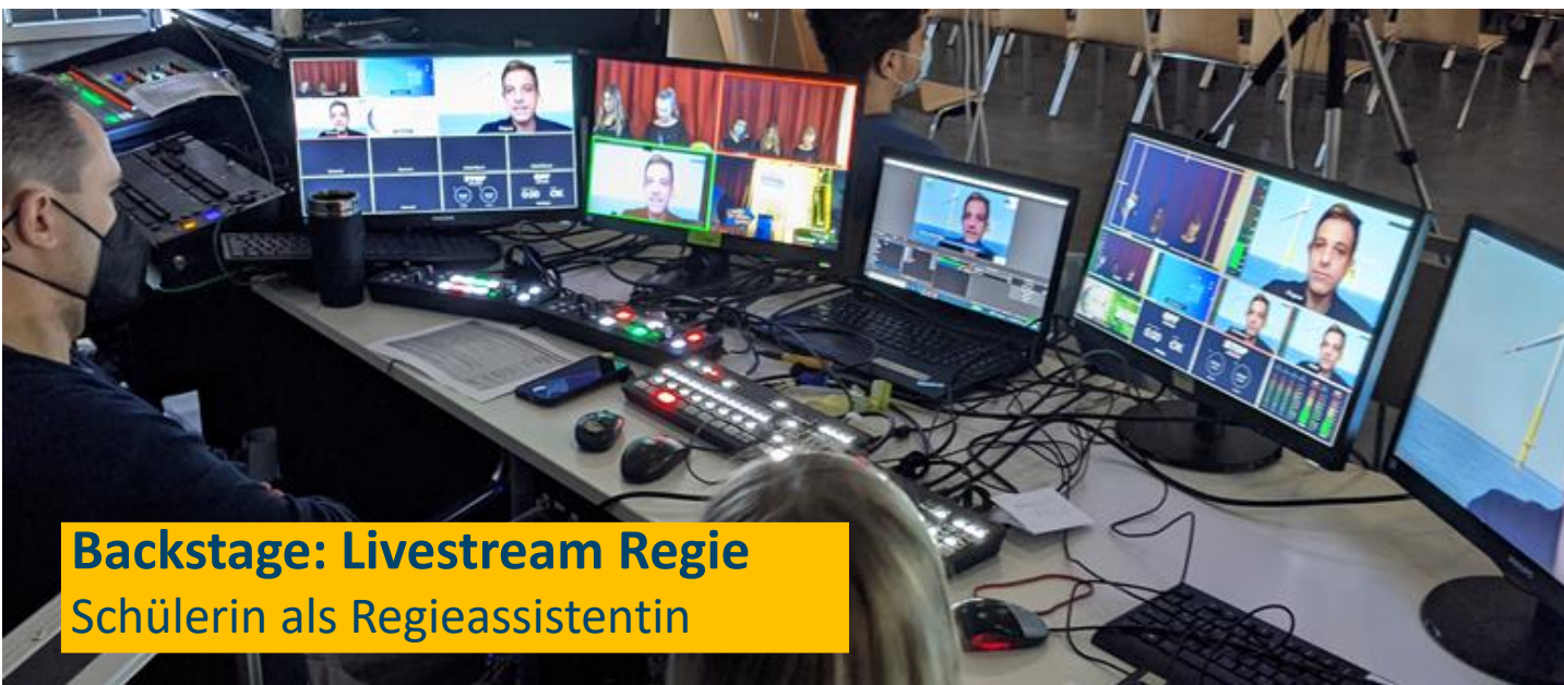
Backstage: Livestream Regie Schülerin als Regieassistentin